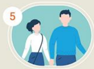
5 อยู่ใกล้กัน ล้อมห่าง 1-2 เมตร