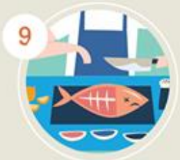
9 กินอาหารที่ปรุง ทิ้งไว้นานแล้ว/อาหารดิบ