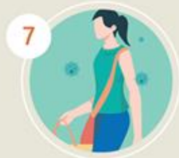
7 ป่วยแล้ว ไม่กักตัวเองอยู่บ้าน