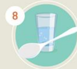
8 ใช้ของส่วนตัว ร่วมกับผู้อื่น