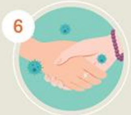
6 กอด หอม จับมือ คนรัก/ครอบครัว