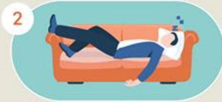
2 ถึงบ้านแล้ว ทิ้งตัวลงนอน ไม่อาบน้ำ เปลี่ยนเสื้อผ้าทันที